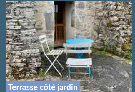
Terrasse côté jardin