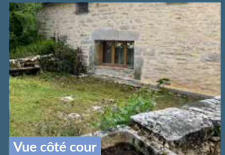
Vue côté cour