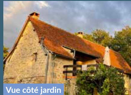
Vue côté jardin