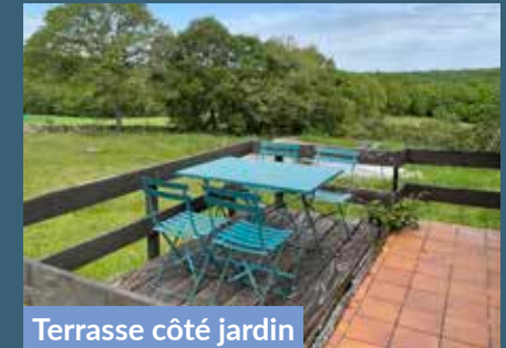
Terrasse côté jardin