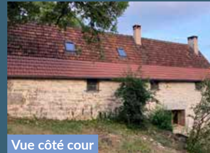
Vue côté cour